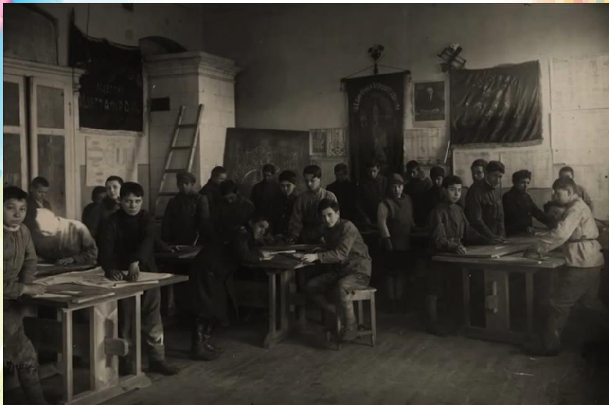
Фото 1. Фрагмент из видеорепортажа «История моей школы» от государственного учреждения образования «Песковская средняя школа Мостовского района».