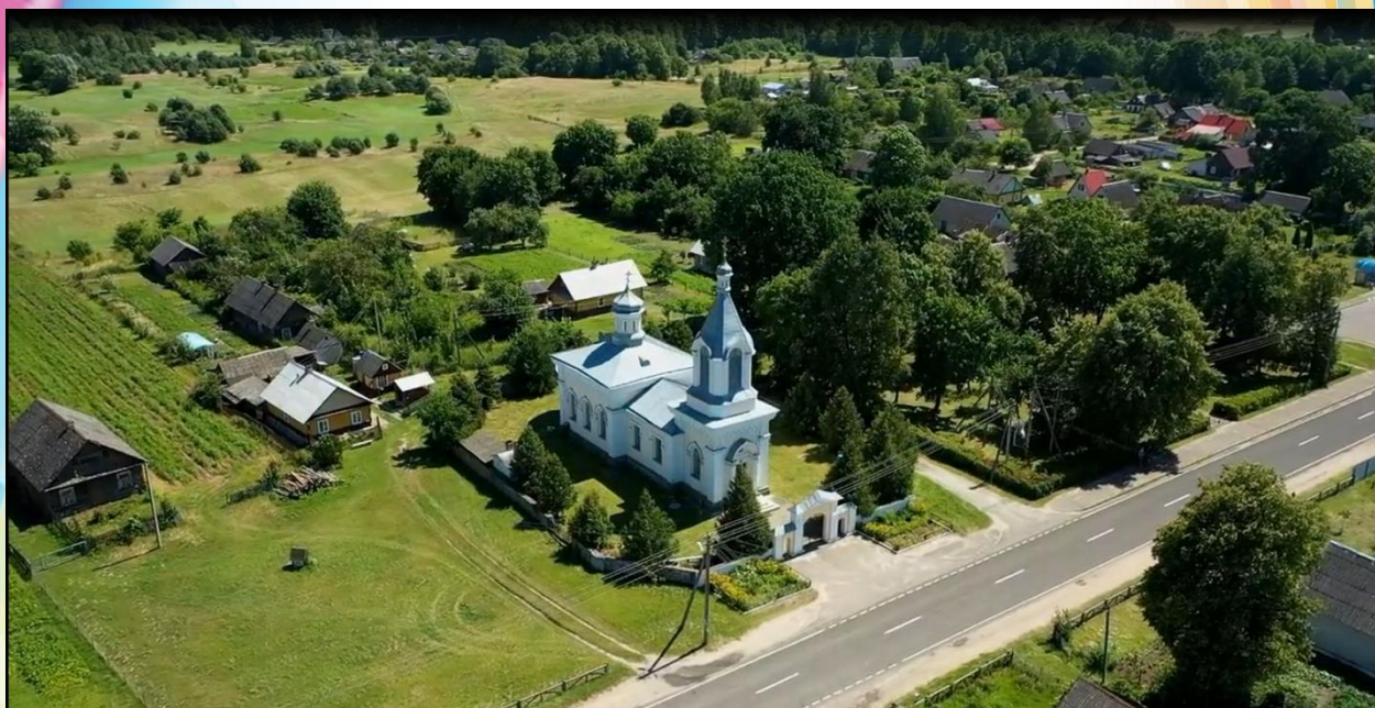
Фото 11. Фрагмент из видеорепортажа «Архитектура» от государственного учреждения образования «Песковская средняя школа Мостовского района»