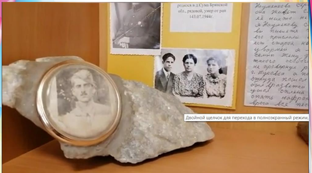
Фото 9. Фрагмент из видеорепортажа «Историческое событие» от государственного учреждения образования «Средняя школа №3 г. Мосты»