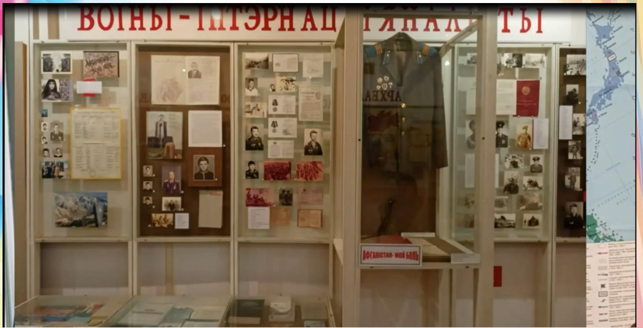
Фото 7. Фрагмент из видеорепортажа «Музейный экспонат» от государственного учреждения образования «Средняя школа №5 г. Мосты» Фото 8. Фрагмент из видеорепортажа «Музейный экспонат» от государственного учреждения образования «Озерковская средняя школа»