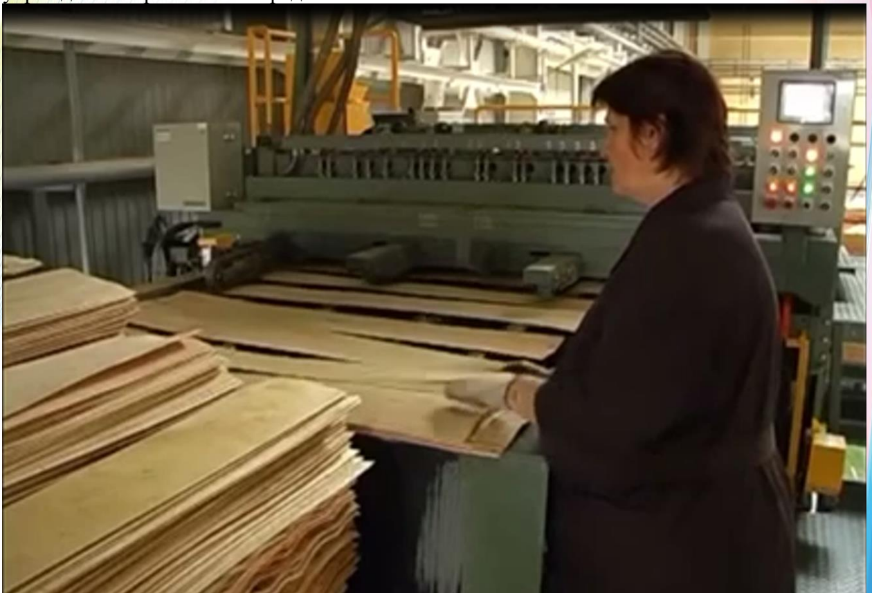
Фото 10. Фрагмент из видеорепортажа «Историческое событие» от государственного учреждения образования «Средняя школа №2 г. Мосты»