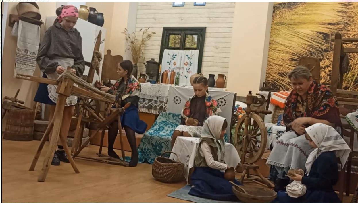
Фото 6. Фрагмент из видеорепортажа «Традиции и обряды на территории Мостовщины» от государственного учреждения образования «Песковская средняя школа Мостовского района»

Фото 5. Фрагмент из видеорепортажа «Традиции и обряды на территории Мостовщины» от государственного учреждения образования «Лунненская средняя школа имени Героя Советского Союза Ивана Шеремета»