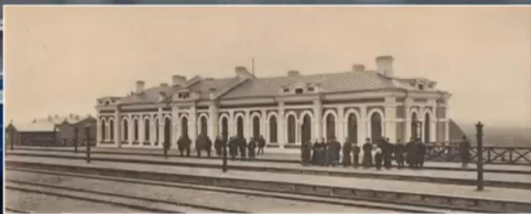
Фото 12. Фрагмент из видеорепортажа «Архитектура» от государственного учреждения образования «Средняя школа №2 г. Мосты»