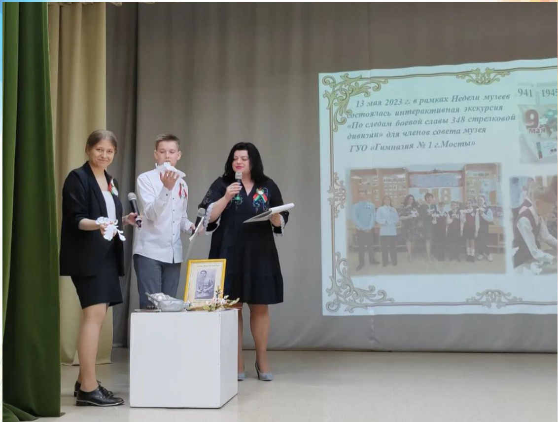
Фото 15. Фрагмент из видеорепортажа «Итоговый этап» государственного учреждения образования «Мостовский районный центр творчества детей и молодежи» Фото 16. Фрагмент из видеорепортажа «Итоговый этап» от государственного учреждения образования «Мостовский районный центр творчества детей и молодежи»