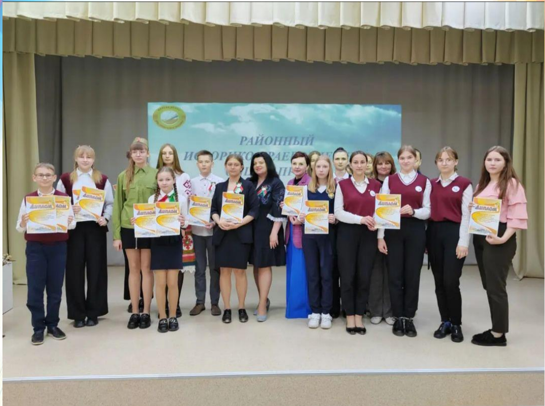
Фото 13. Фрагмент из видеорепортажа «Итоговый этап» государственного учреждения образования «Мостовский районный центр творчества детей и молодежи» Фото 14. Фрагмент из видеорепортажа «Итоговый этап» от государственного учреждения образования «Мостовский районный центр творчества детей и молодежи»